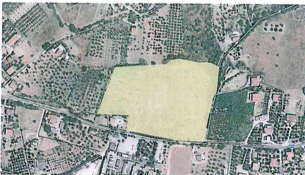
Terreno in Via Maddalena