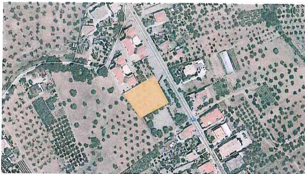
Terreno in Via Piano della Cona