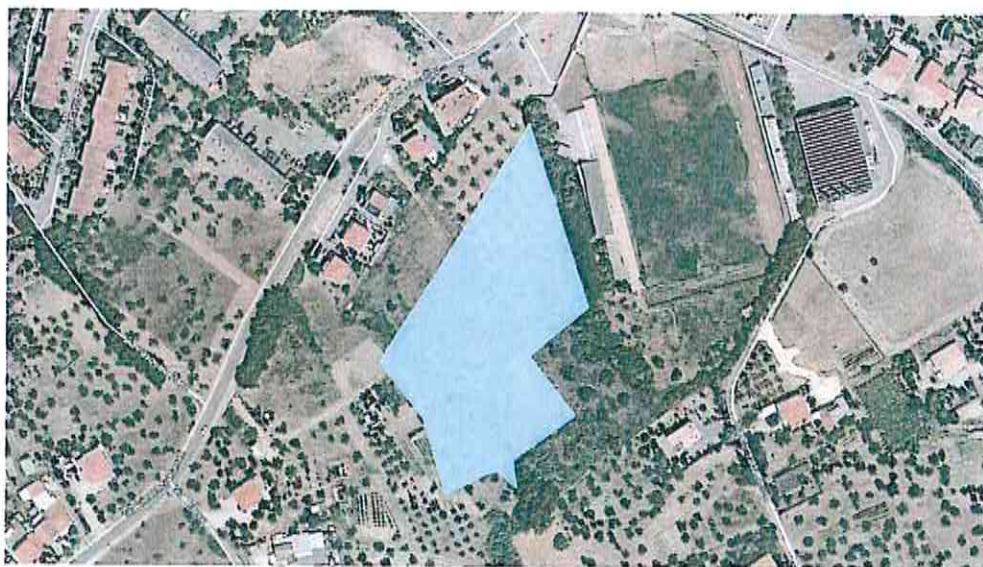
Terreno nei pressi del campo sportivo

65013 CITTÀ SANT'ANGELO (Pescara) Piazza IV Novembre - Tel. 085.9696217 - Fax 085.9696227 info@comune.cittasantangelo.pe.it - pec: comune.cittasantangelo@pec.it Cod. Fisc./Partita IVA: 00063640684