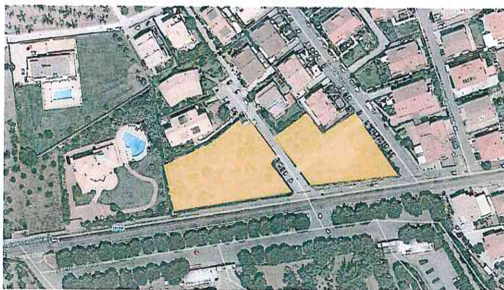
Terreni in Via Vincenzo Cilli

65013 CITTÀ SANT'ANGELO (Pescara) Piazza IV Novembre - Tel. 085.9696217 - Fax 085.9696227 info@comune.cittasantangelo.pe.it - pec: comune.cittasantangelo@pec.it Cod. Fisc./Partita IVA: 00063640694